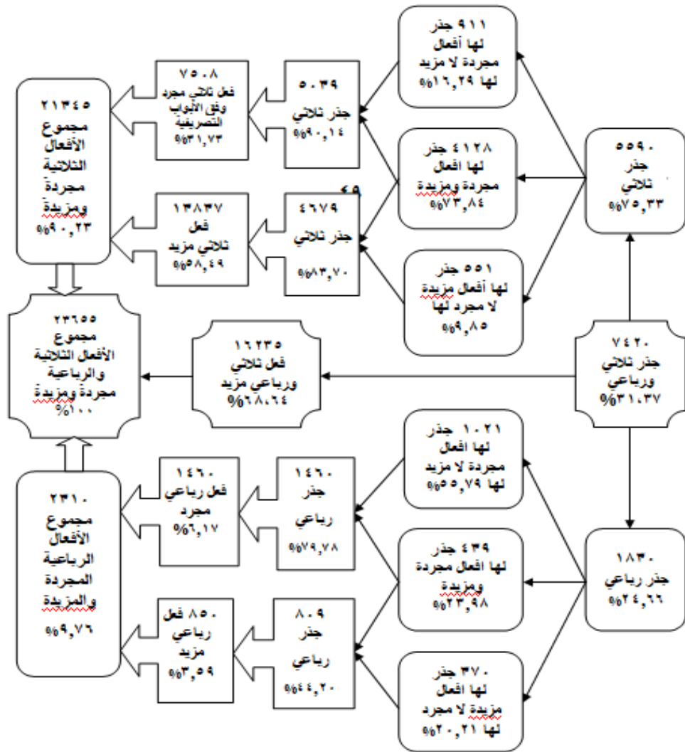
الشكل (١): شكل صندوقي لإحصائيات الأفعال العربية الثلاثية والرباعية المجردة والمزيدة ٢١