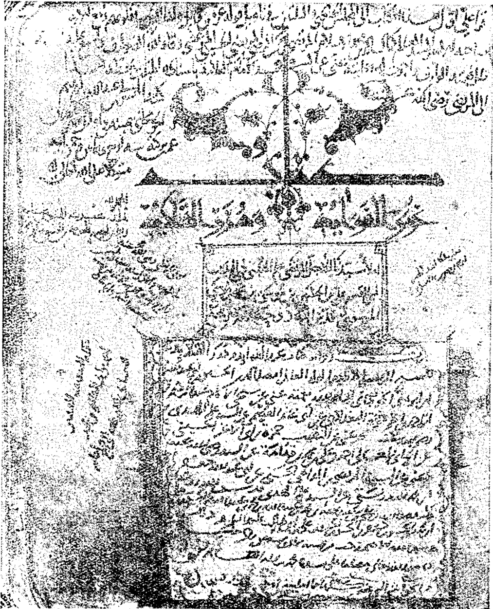
عنوان الكتاب من نسخة الأصل