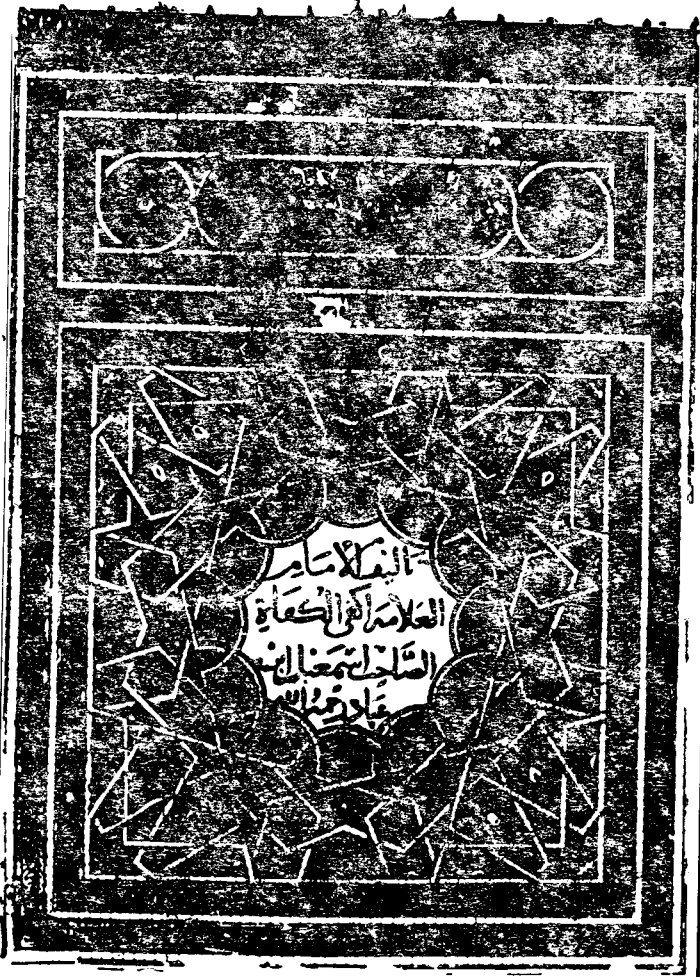
« صورة الصفحة ١/أ من النسخة الأصل » « نسخة المتحف البريطاني »