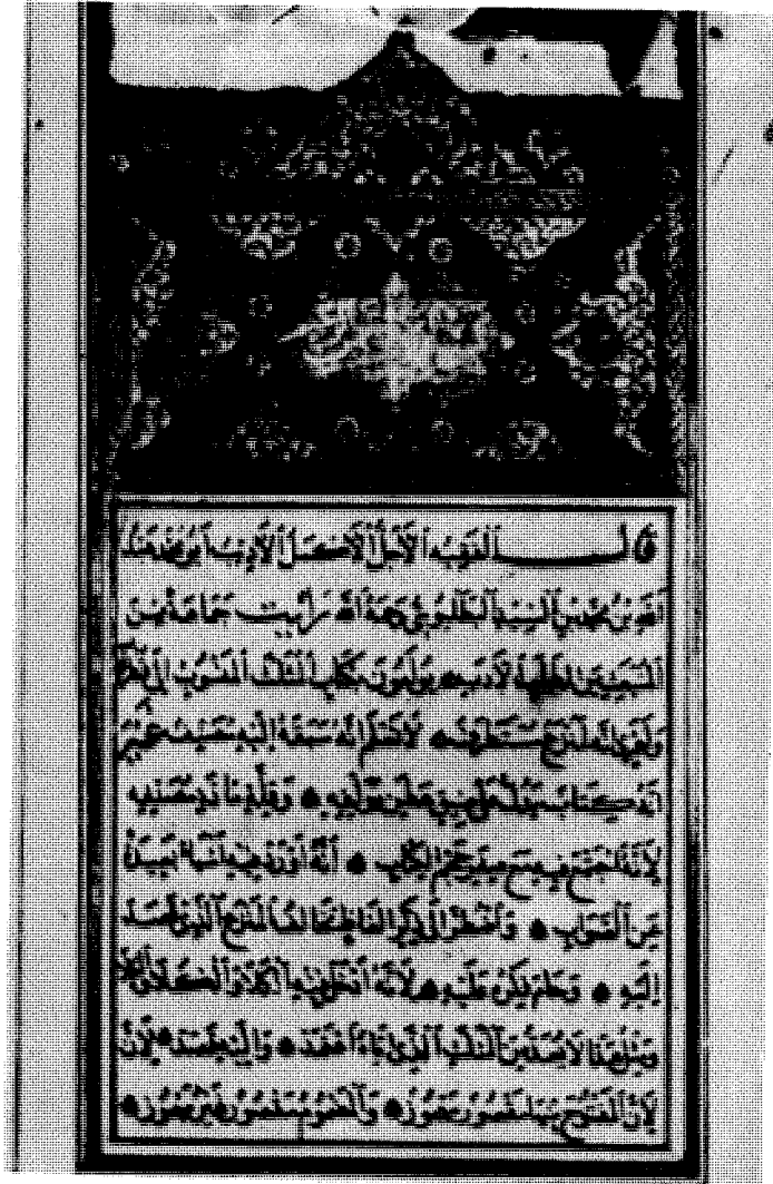
الصفحة الأولى من نسخة عاطف أفندي