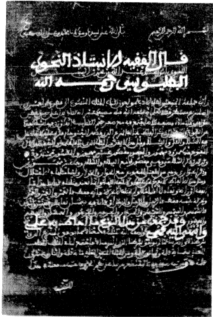
الصفحة الأولى من نسخة دار الكتب