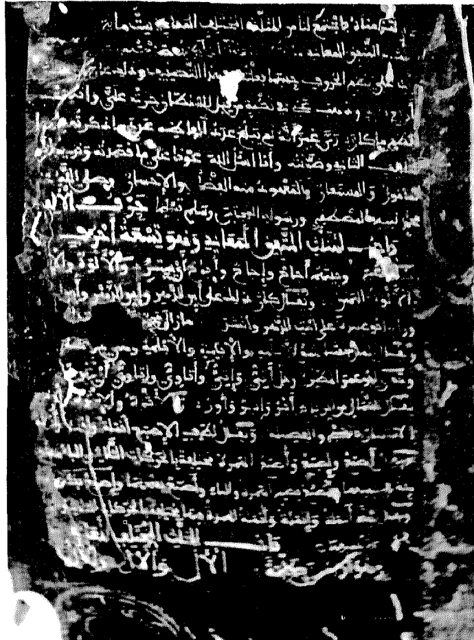
الصفحة الأولى من نسخة فاس