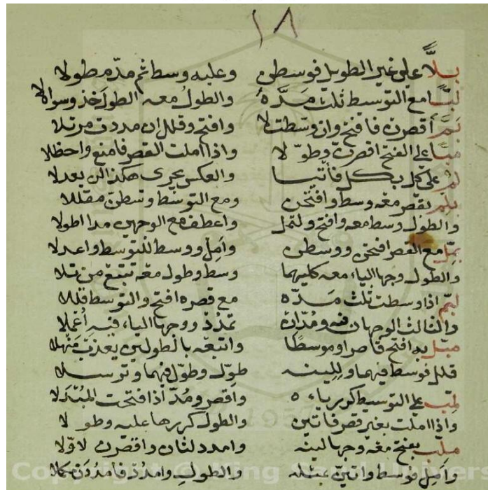
( الورقة الأخيرة من المخطوطة )