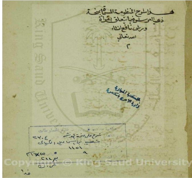
(الورقة الأولى من المخطوطة)