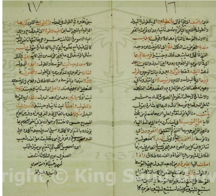
( الورقة قبل الأخيرة من المخطوطة )