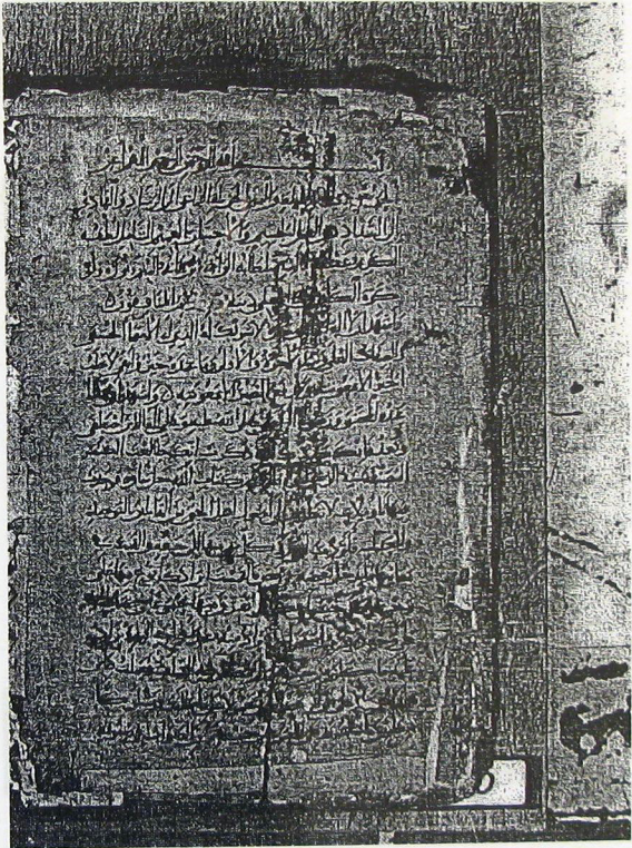
الصفحة الأولى من نسخة مورتانيا