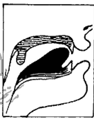
(٩) السين والزاي

٩ - حَافَّةُ اللِّسَانِ : أى أَحَدُ جانبيه مع ما يليه من الأضراس العليا فيمكن إصْصاق الحَافَّةِ اليمنى بما يليها من الأضراس ، أو الحَافَّةِ اليسرى بما يليها كذلك ، ويمكن إصْصاق كلتا الحَافَّتَيْنِ بكلا الجانبيين من الأضراس : ومن هذا المخرج تخرج الضاد ، وهو أصعب المخرج ، وحكى أبو شامة أن عمر بن الخطاب كان يُخرج هذا الحرف من الحافتين .