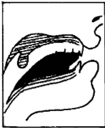
مخرجها عند ابن الجزري