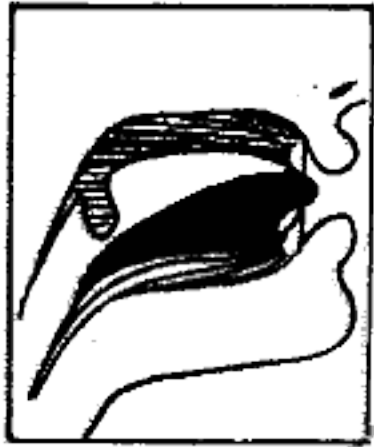
(٧) الثاء والذال