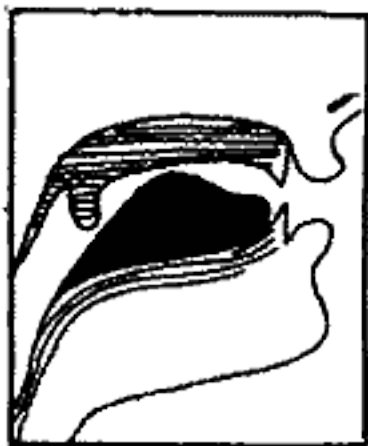
(٣) الجيم والشين والياء

٣ - وسط اللسان : مع وسط الحنك الأعلى ، ومنه تخرج الجيم والشين والياء . انظر الشكل رقم (٣).