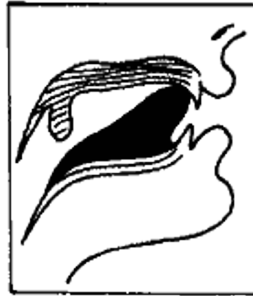
(١٣) مخرج اللام عند الفراء