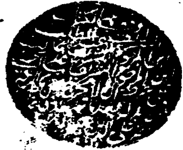
اللوح الأول من نسخة الحرم المكي، ورمزها (ح)