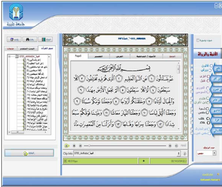
الشكل ذو الرقم (3)

وتفصيلاً ففي الشاشة شكل (4) نرى الآية التي تم اختيارها في الشاشة الأولى، ومعها في المساحة المخصصة لذلك يتم ظهور طريقة الجمع مرقما حسب قواعد الجمع، وهذا مصاحب لصوت الشيخ الذي يقرأ جمعا، والذي يتم سماعه بواسطة النظام وبعد الضغط على الأيقونات الخاصة بذلك، وبذلك يتمكن الدارس أو المستخدم لهذا النظام لتعلم القراءات من سماع ورؤية الجمع صوتا وكتابة؛ مع إمكان تكرار ذلك عدة مرات بهدف التدريب وتثبيت التعليم.