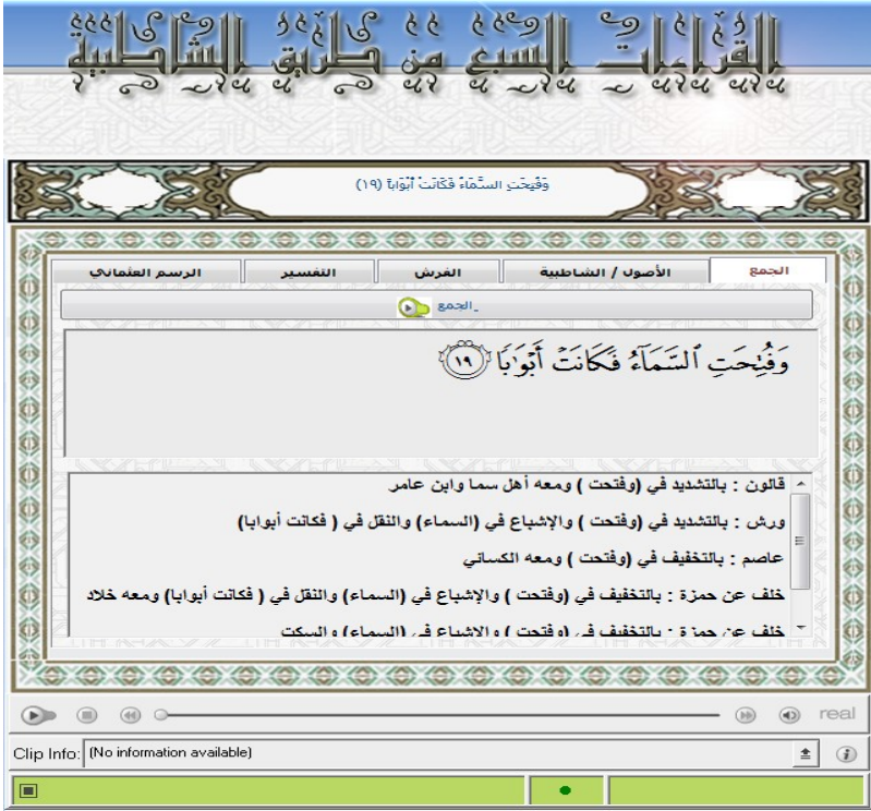
الشكل ذو الرقم (4)

ولتعميق التدريب - وذلك من خلال معرفة الأصول والفرش التي تم الاعتماد عليها في قراءة الجمع - فإنه يتم في الشاشة ذات الرقم: (5)، ومن خلال أيقونة: استعراض أصول القراءة للآية المعروضة، واختلاف القراء والرواة في قراءتها (وذلك إن ظهر في هذه الآية المعروضة) مع إيراد الدليل من متن الشاطبية، وهذا ما تم في تسجيل وكتابة الملفات