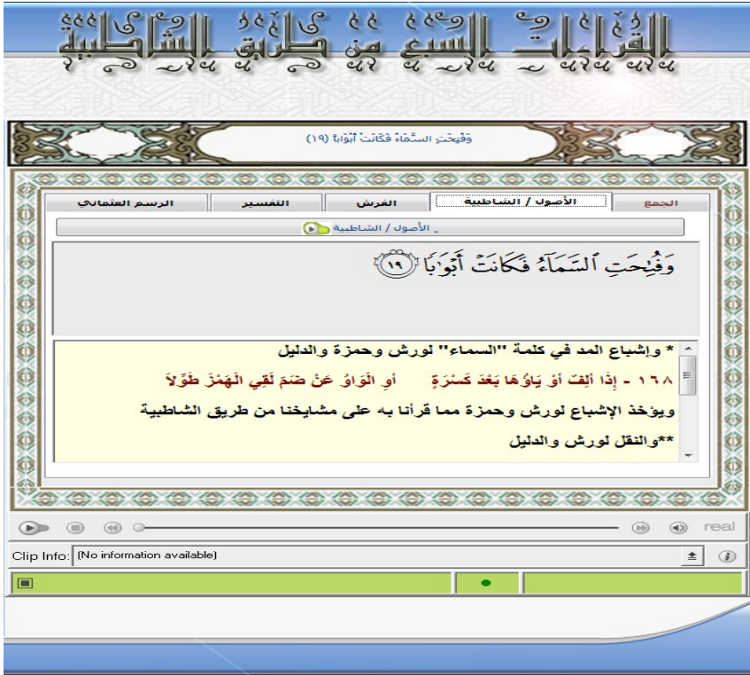
الشكل ذو الرقم (5)

الخاصة بالبرنامج، وتظهر في شاشة النظام أيضا. وكذلك الشاشة في الشكل ذو الرقم (6) بالنسبة للفرش.