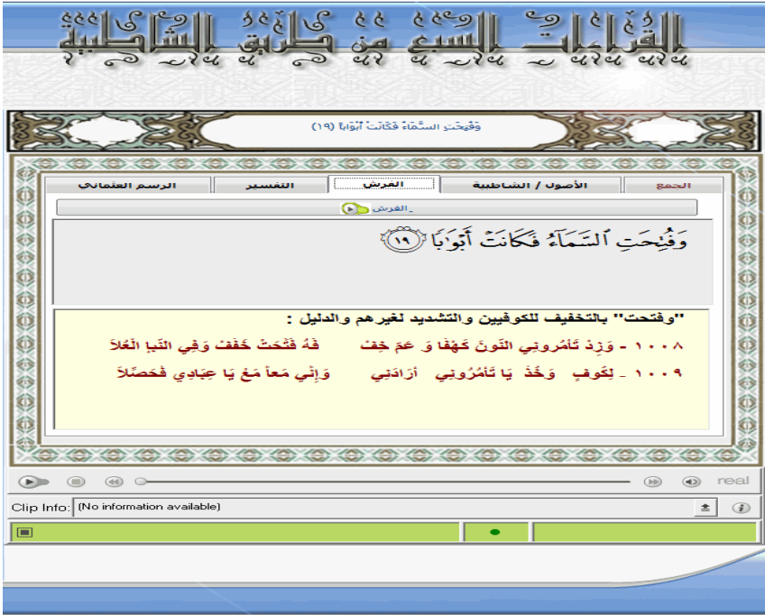
الشكل ذو الرقم (6)