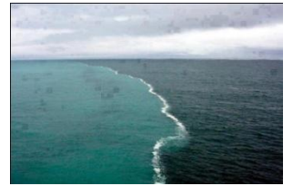
هذه الصورة للبحرين بينهما برزخ

(مَرَجَ الْبَحْرَيْنِ يَلْتَقِيَانِ * بَيْنَهُمَا بَرْزَخٌ لَا يَبْغِيَانِ * فَبِأَيِّ آلاءِ رَبِّكُمَا تُكَذِّبَانِ) (الرحمن: ١٩-٢١).