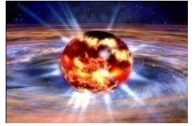
هذه الصورة للنجم الطارق

فكلمة (الطارق) تعبر تعبيراً دقيقاً عن عمل هذه النجوم، وكلمة (الثاقب) تعبر تعبيراً دقيقاً عن نواتج هذه النجوم وهي الموجات الثاقبة، ولا نملك إلا أن نقول: سبحان الله!