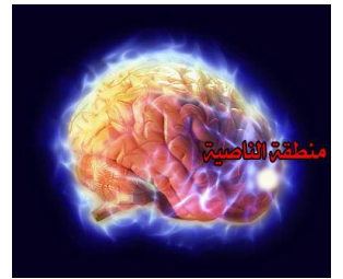
هذه الصورة للمخ والناصية الكاذبة

اكتشف العلماء حديثاً أن المنطقة المسؤولة عن الكذب هي مقدمة الدماغ أي الناصية، واكتشفوا أيضاً أن منطقة الناصية تنتشط بشكل كبير أثناء الخطأ، ولذلك فقد خلصوا إلى نتيجة أو حقيقة علمية أن عمليات الكذب وعمليات الخطأ تتم في أعلى ومقدم الدماغ في منطقة اسمها الناصية، والعجيب أن القرآن تحدث عن وظيفة هذه الناصية قبل قرون طويلة فقال: ناصية كاذبة خاطئة ، فوصف الناصية بالكذب والخطأ وهذا ما يراه العلماء اليوم بأجهزة المسح المغناطيسي، فسبحان الله..