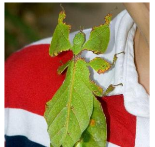
هذه الصورة حشرة أم ورقية

نرى في هذه الصورة حشرة غريبة، ويعجب العلماء كيف استطاعت هذه الحشرة أن تحاكي الطبيعة بهذا التقليد الرائع، بل كيف علمت أنها ستختفي من أعدائها في أوراق الأشجار، وكيف استطاعت أن تجعل من جسمها ورقة لا يستطيع تمييزها إلا من يدقق فيها طويلاً ؟ إنها تساؤلات يطرحها العلماء الماديون، ولكننا كمؤمنين نقول كما قال الله تعالى (وَاللَّهُ خَلَقَ كُلَّ دَابَّةٍ مِنْ مَاءٍ فَمِنْهُمْ مَنْ يَمْشِي عَلَى بَطْنِهِ وَمِنْهُمْ مَنْ يَمْشِي عَلَى رِجْلَيْنِ وَمِنْهُمْ مَنْ يَمْشِي عَلَى أَرْبَعٍ يَخْلُقُ اللَّهُ مَا يَشَاءُ إِنَّ اللَّهَ عَلَىٰ كُلِّ شَيْءٍ قَدِيرٌ) [النور] 45 :