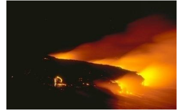
هذه الصورة للبحر المسجور

والتسجير في اللغة هو الإحماء تقول العرب سجر التتور أي أحماه، وهذا التعبير دقيق ومناسب لما نراه حقيقة في الصور اليوم من أن البحر يتم إحماؤه إلى آلاف الدرجات المئوية، فسبحان الله!