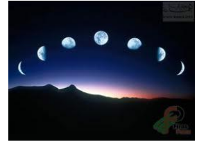
هذه الصورة لنور القمر

وجد العلماء حديثاً أن القمر جسم بارد بعكس الشمس التي تعتبر جسماً ملتهباً، ولذلك فقد عبر القرآن بكلمة دقيقة عن القمر ووصفه بأنه (نور) أما الشمس فقد وصفها الله بأنها (ضياء)، والنور هو ضوء بلا حرارة ينعكس عن سطح القمر، أما الضياء فهو ضوء بحرارة تبثه الشمس، يقول تعالى: (هُوَ الَّذِي جَعَلَ الشَّمْسَ ضِيَاءً وَالْقَمَرَ نُورًا وَقَدَرَهُ مَنَازِلَ لِتَعْلَمُوا عَدَدَ السِّنِينَ وَالْحِسَابَ مَا خَلَقَ اللَّهُ ذَلِكَ إِلَّا بِالْحَقِّ يُفَصِّلُ الْآيَاتِ لِقَوْمٍ يَعْلَمُونَ) من كان يعلم زمن نزول القرآن أن القمر جسم بارد؟ إن هذه الآية لتشهد على صدق كلام الله تبارك وتعالى.